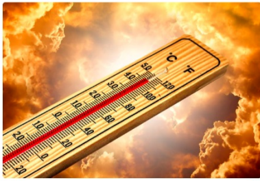
TEADUS NEW SCIENTIST | 2023 on ajaloo kuumim aasta ning temperatuurid vaid kerkiavad