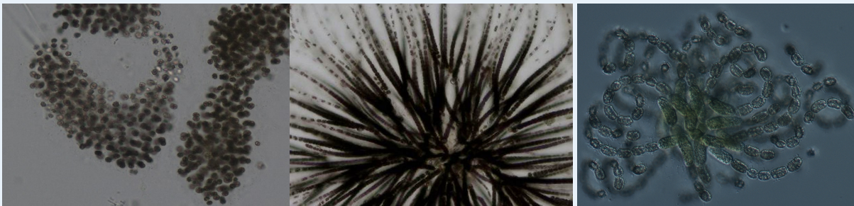
Verschiedene Arten von Blualgen aus dem Peipussee: Microcystis, Gloeotrichia (z.B. Igellalgen), Dolichospermum mit Sporen.

Blualgen sind im Sommer in unseren Gewässern häufig anzutreffen - sie mögen warmes Wasser. Sie können auch selbst Stickstoff binden, so dass ein Stickstoffmangel ihr Wachstum nicht beeinträchtigt. Blualgen können sehr zahlreich sein, und die Veränderung der Wasserfarbe ist mit bloßem Auge zu erkennen - wenn sich Flocken oder runde Kolonien im Wasser befinden oder die Farbe des Wassers bläulich-grün ist, lohnt es sich, nach dem Schwimmen zu duschen!